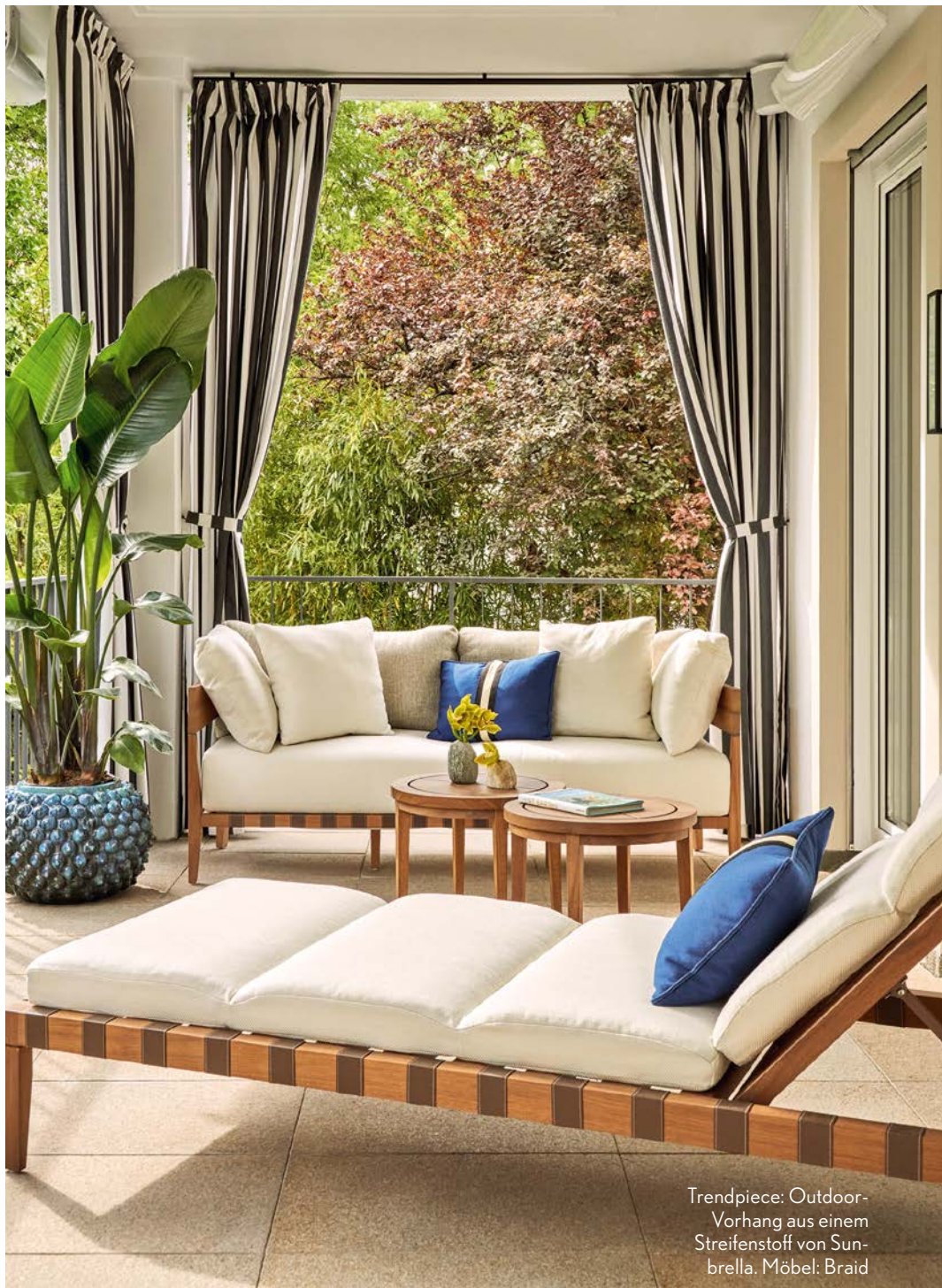
Trendpiece: Outdoor-Vorhang aus einem Streifenstoff von Sunbrella. Möbel: Braid